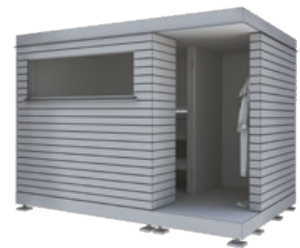
Nido mit Vorraum